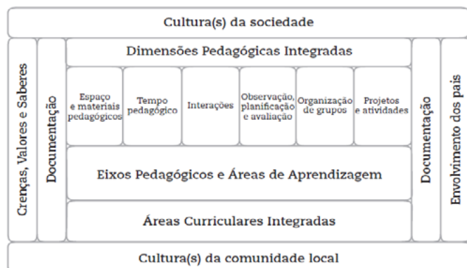
Figura 2. Dimensões da Pedagogia Integrada (Oliveira-Formosinho & Formosinho, 2013, p.25).

As várias dimensões pedagógicas são fundamentais à prática pedagógica constituindo-se como bússolas que norteiam a acção do Educador, no dia-a-dia com as crianças.