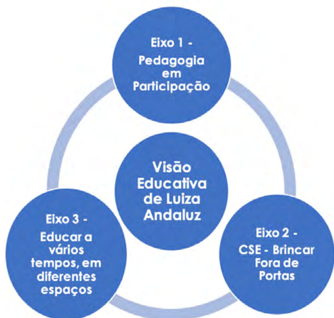
Figura 3. Interligação dos três eixos tendo como principal interligação a visão educativa de Luiza Andaluz

Ao anterior projecto alteraram-se os eixos no sentido de tornar a Visão de Luiza a base/elo de ligação entre os novos eixos que agora são priorizados.